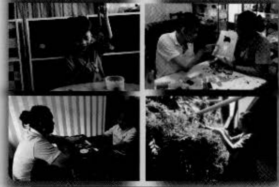
การฝึกทักษะต่างๆ